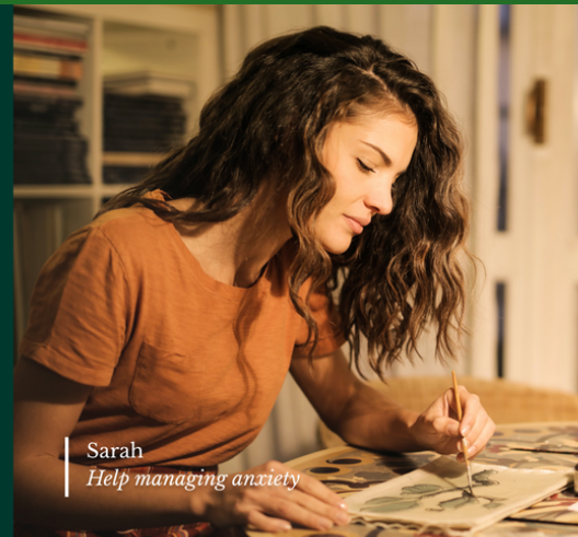
Sarah Help managing anxiety